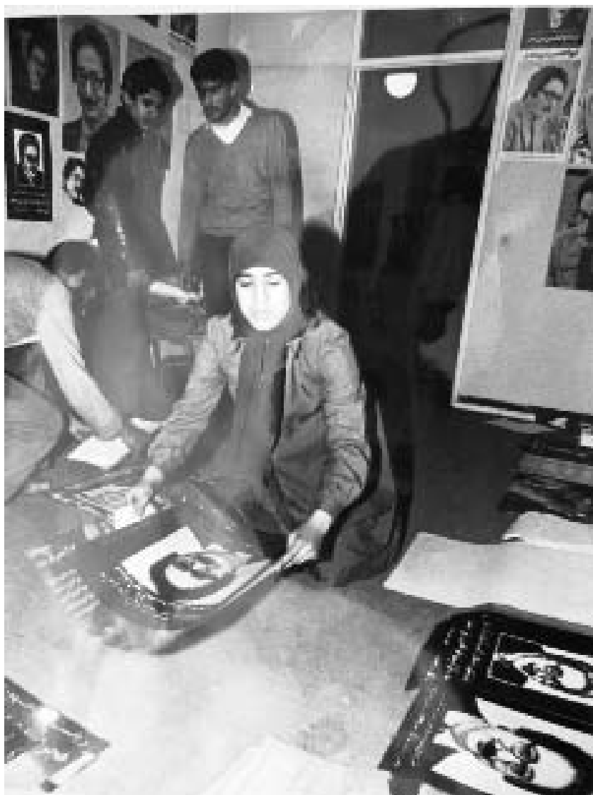
یکی از مراکز هماهنگی تبلیغات انتخاباتی ریاست جمهوری آقای بنی صدر در تهران