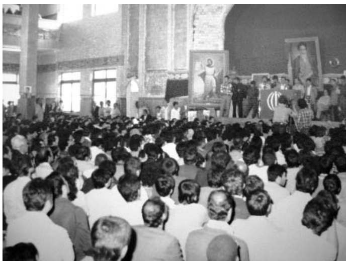
در تاریخ ۲۸ اردیبهشت ۱۳۶۰، سخنرانی در حسینیه بنی فاطمه با حضور ریاست جمهوری