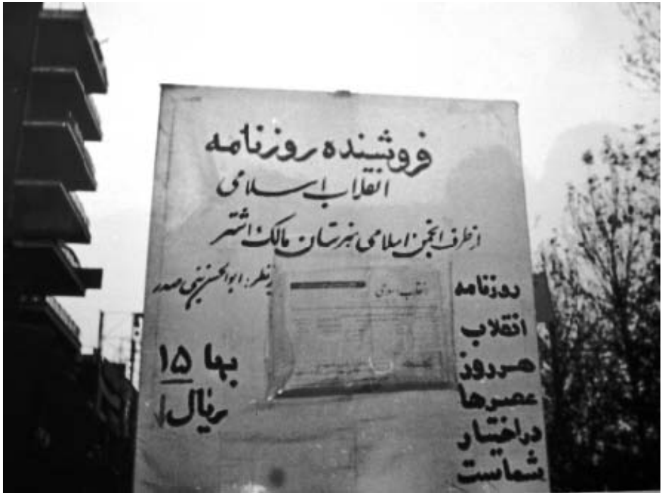
نمونه ای از توزیع مردمی روزنامه انقلاب اسلامی