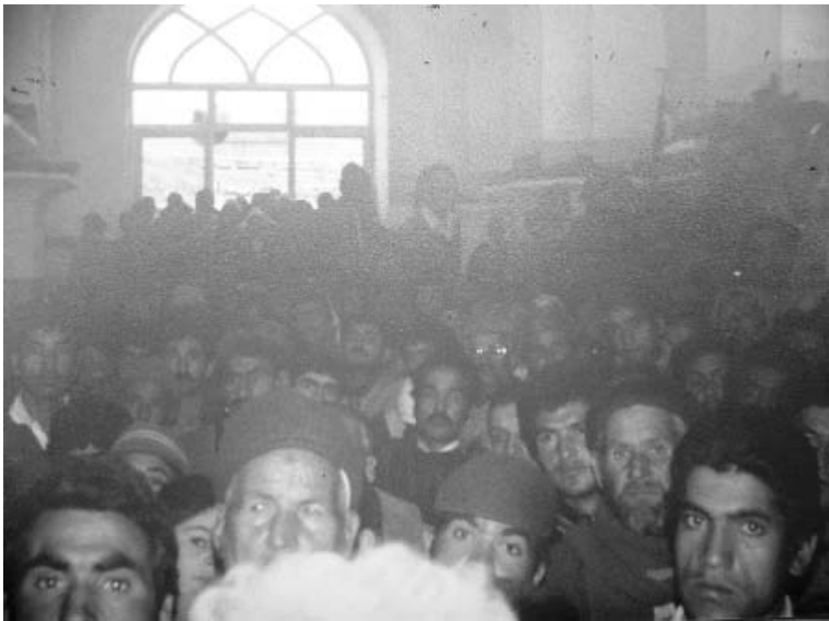
سخنرانی در مسجد جامع کاشمر در تاریخ جمعه ۵۹/۹/۲۸