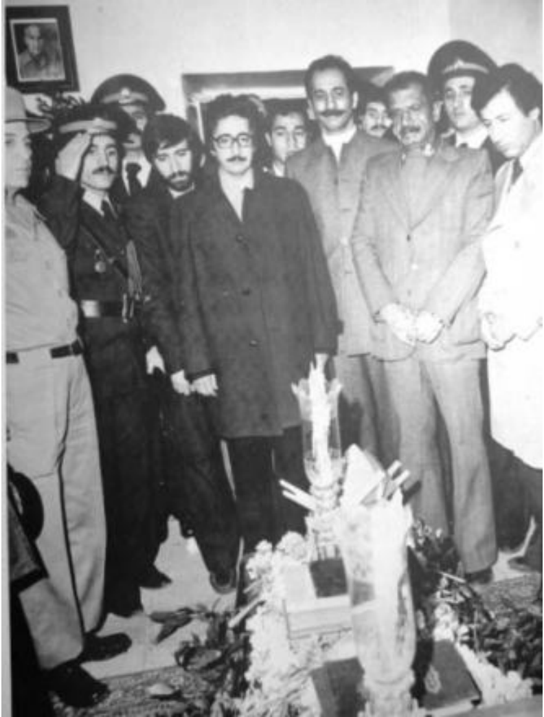
ادای احترام رئیس جمهور ۱۴ اسفند ۱۳۵۹ بر مزار آقای دکتر محمد مصدق مصدق