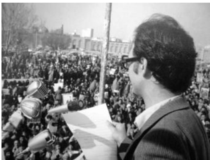
سخنرانی در مسجد گوهرشاد در تاریخ ۴ بهمن ۱۳۵۹