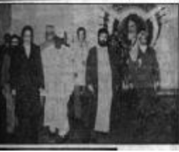
تاریخچه و سوابق هیئت رسیدگی کننده به جنگ داخلی ایران

پیام مهم رئیس جمهوری در این شماره به مناسبت سالروز تأسیس جمهوری اسلامی ایران به چاپ رسیده است.