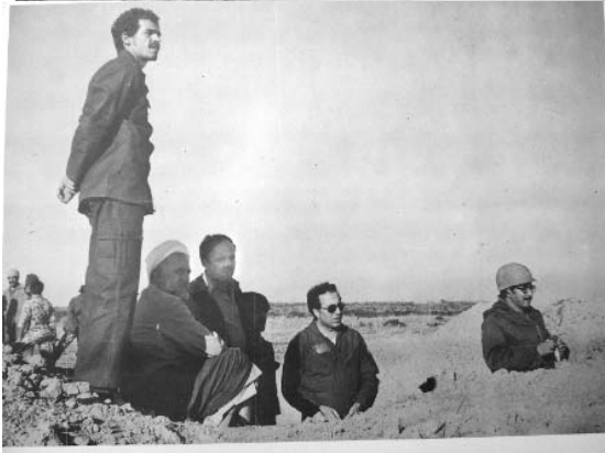
رئیس جمهور و فرمانده کل قوا در جبهه جنگ