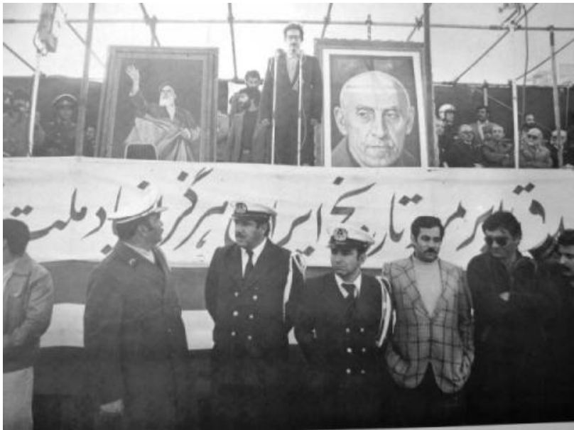
۱۴ اسفند ۱۳۵۹، سخنرانی دکتر بنی صدر در دانشگاه تهران