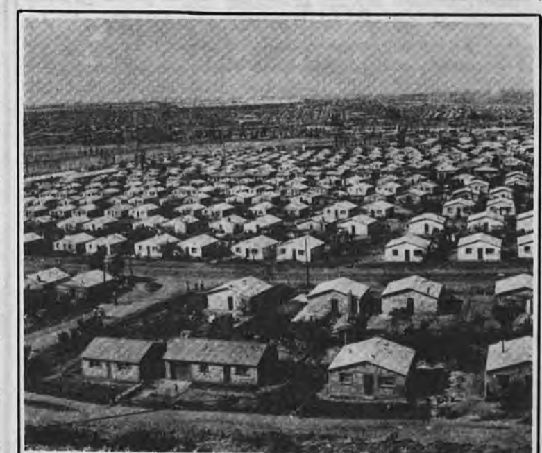
نشانه های از عدالت سفید پوستان

در نتیجه این شرایط سختی که بر زندگی مردم سووتو حاکم است و از سیاست تبعیض نژادی ناشی میشود تعداد مردان در سووتو روز بروز کاهش میابد زیرا بسیاری از آنها به انقلابیون میپیوندند گروهی ناپدید میشوند و گروهی دیگر یکدیگر را می کشند. این مسئله سبب شده است که زنان علیرغم ستم و برقراری و استثماری که از سوی سفیدپوستان میبینند جهت تأمین مخارج خانواده هایشان در دفاتر و خانه های آنها بکار بپردازند. سیاهان در آنچنان شرایطی بسر میبرند که حتی امنیت هم ندارند مثلاً پس از اتمام کار باید دستجمعی به خانه هایشان برگردند زیرا در غیر اینصورت از حمله راهزنان و سرقت اموالشان در امان نخواهند بود حتی زمانی که شبها اضافه کاری میکنند مجبورند پس از پایان کار در محل های امنی مخفی شوند تا بتوانند فردای آن روز به خانه برگردند. این شرایط موجب میشود که گاهی، سیاهان چندین هفته از دیدن خانواده هایشان محروم بمانند برای نمونه بعضی از خانواده های یک پدر، مادر و فرزندان آنها کار میکنند ممکن است نتوانند همیشه یکدیگر را ببینند زیرا هر کدام در شرایطی بسر میبرد که از شرایط دیگری سخت تر است.