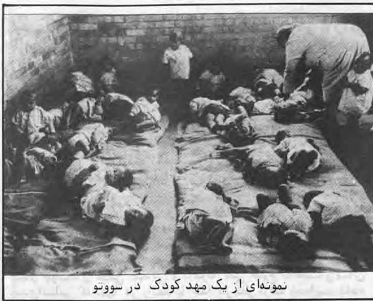
نمونه ای از یک مهد کودک در سووتو