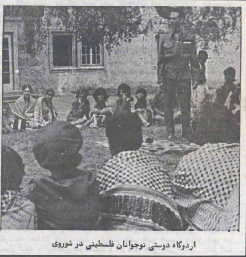
اردوگاه دوستی نوجوانان فلسطینی در شوروی

اهمیت فلسطین و فلسطینیها از سه جهت نه تنهای برای انقلاب اسلامی ایران بلکه برای منطقه خاورمیانه حائز اهمیت میباشد: