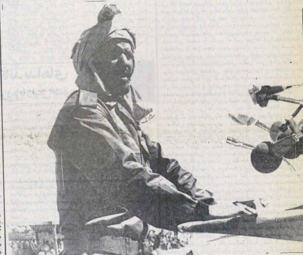
سخنرانی محمد امین الاحمد نخست وزیر جمهوری دمکراتیک صحرا

ملک حسین پادشاه مغرب در آخرین پیشنهادی که به مردم صحرا ارائه داد در آن از نوعی خودمختاری یا خودگردانی داخلی صحبت کرده ستوال ما این است که موضع دولت صحرا درقبال این پیشنهاد چیست؟