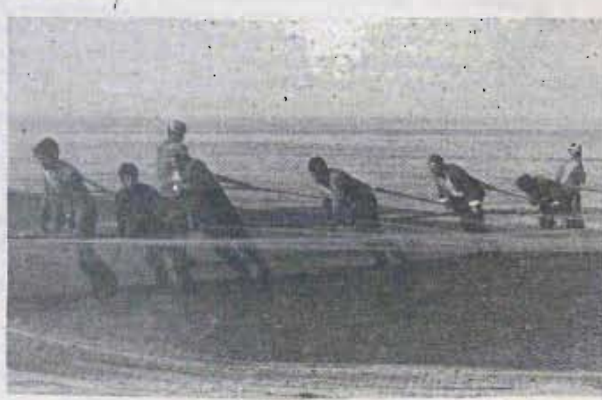
صید بی رویه صیادان زحمتکش را نیز با کمبود ماهی روبرو کرده است.

بعلمت توره های فراوان در دهانه رودها اکثر ماهیها نمیتوانند برای تخمگذاری و از دیاد نسل به رودخانه های آب شیرین مهاجرت کنند