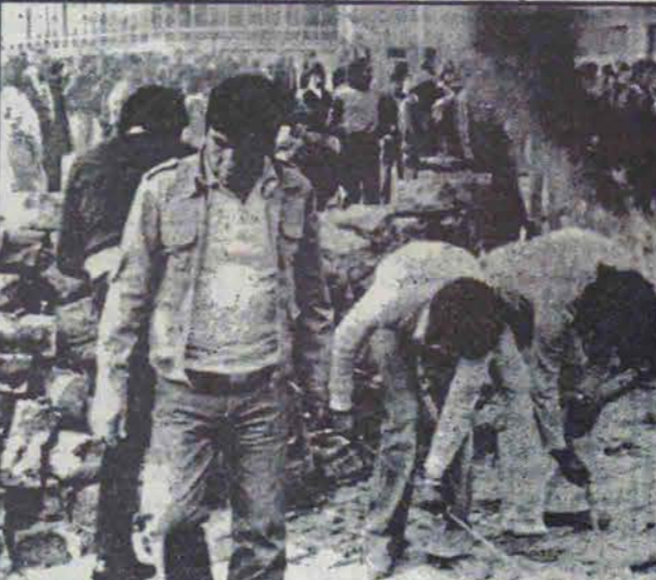
توسط مردم همیشه در ذهن زمامداران انعکاسی از رشادت مردم بولیوی را زنده نگه میدارد.