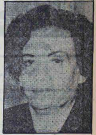
خانم لیدیگایر رئیس جمهور برکنار شده ژنرال گارسیا مازا رهبر کودتا