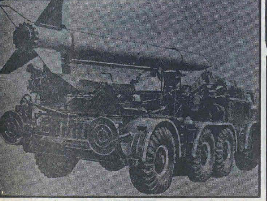
مشخصات موشک زمین به زمین قور باغه ۷ FROG 7

در حمله موشکی عراق به سوسنگرد ۵ نفر از اعضای یک خانواده بشهادت رسیدند