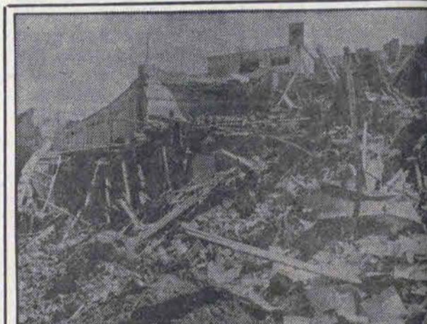
کلوله باران شهرهای آبادان و خرمشهر همچنان ادامه دارد