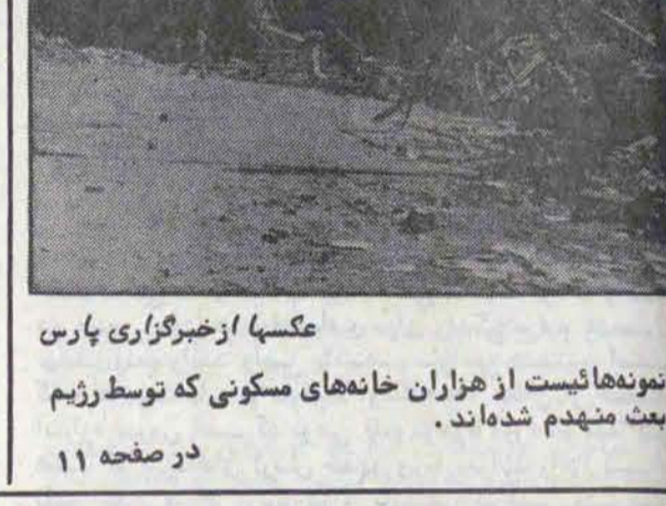
نمونه های بیست از هزاران خانه های مسکونی که توسط رژیم بعث منهدم شده اند.

اعدامها و شکنجه ها در عراق نوعی فلج بوجود آورده است