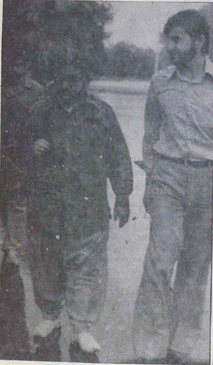
خلخالی، پس از گفتگو با خبرنگارها، اسلحه بدوش زائران بسوی جبهه به پیش می‌رود...

انقلاب اسلامی: فرماندهان و مقامات ارتش می‌گویند ارتش قبل از اینکه وارد جنگ بشود استعداد و آمادگی‌اش را بخاطر مداخلاتی که