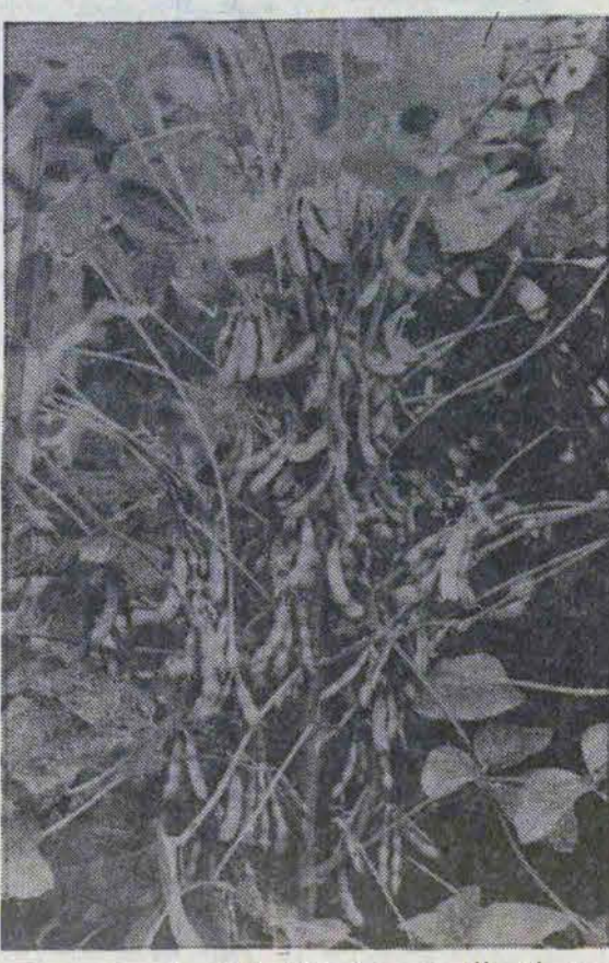
در اثر بالا رفتن سطح دانش کشاورزان و توسعه مکانیزاسیون این بازرگی در سال ۵۸ و ۵۹ به ترتیب ۱۹۰ و ۱۶۵۰ کیلوگرم افزایش یافته که در قبال مقایسه با جدول زیر نشان میدهد که افزایش بازرگی این زراعت در ایران نسبت به سایر کشورهای دیگر دنیا از جمله آمریکا و برزیل که سابقه طولانی در کشت این نبات دارند چشمگیر میباشد.

توسعه کشت دانه‌های روغنی از یکسو از خروج ارز از مملکت جلوگیری می‌کند و از سوی دیگر موجب تولید کار در روستاها و اجرای صحیح تناوب کشت و زراعت و همچنین بالا رفتن ارزش افزوده کارخانجات روغن گشتی خواهد شد.