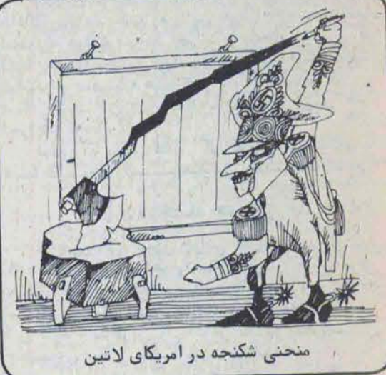
منحنی شکنجه در امریکای لاتین